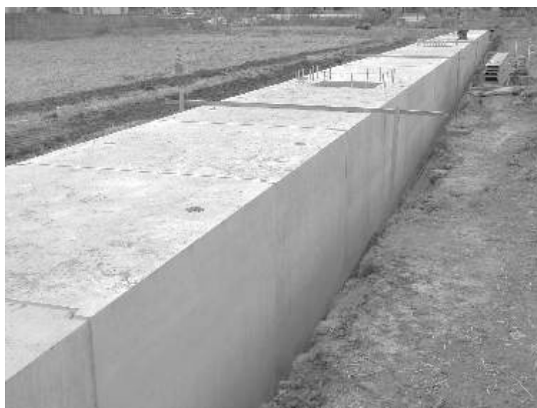
大供周辺土地区画整理事業