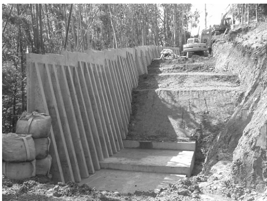
奈義町役場（小谷線）