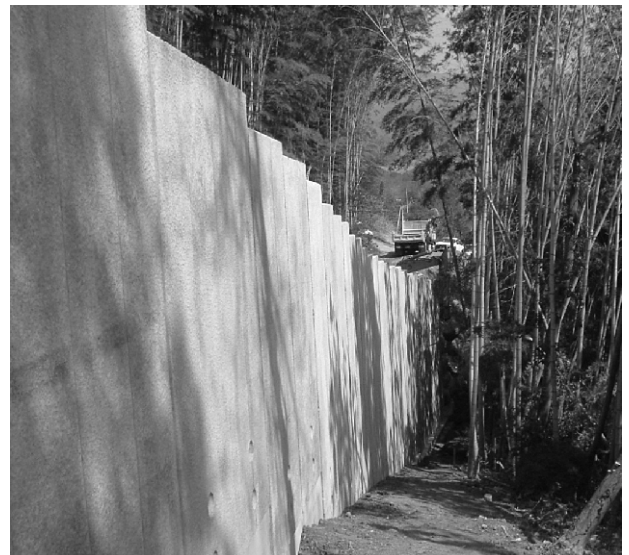
奈義町役場（小谷線）