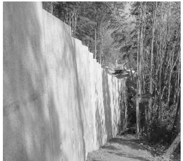
奈義町役場（小谷線）