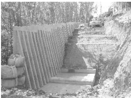
奈義町役場（小谷線）