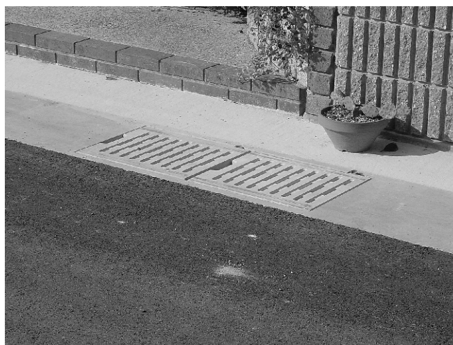
玉野市役所 (玉野市田井)