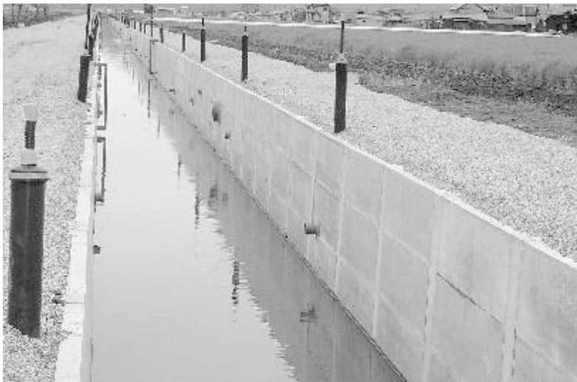
児島湾土地改良区