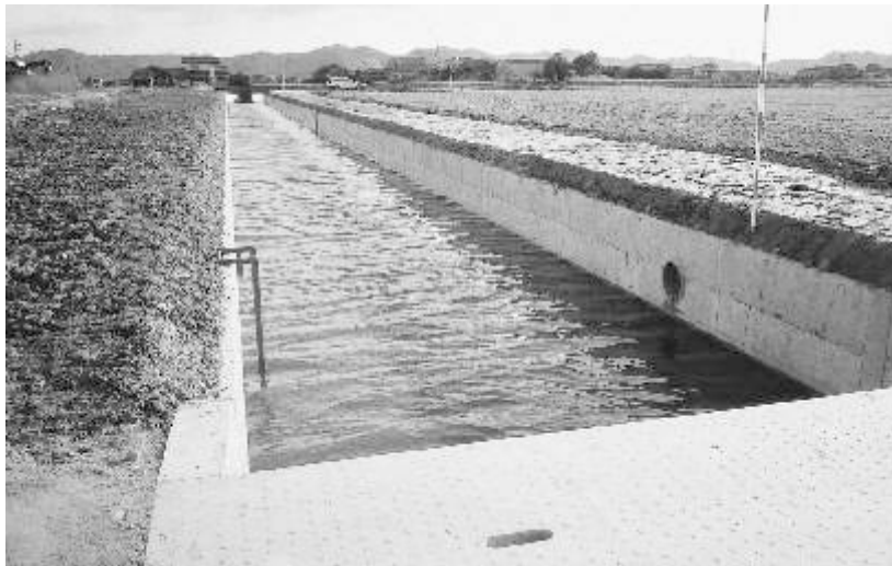
児島湾土地改良区