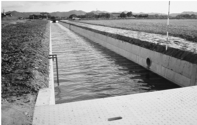
児島湾土地改良区