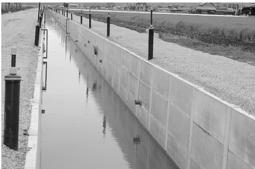
児島湾土地改良区